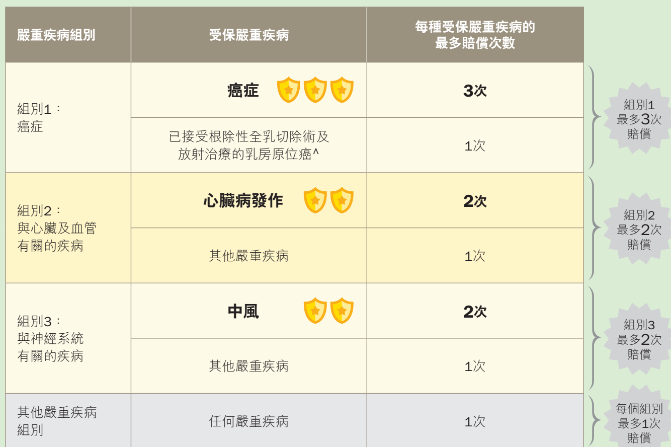
基本計劃及「多重附加契約 (加強版)」下的最多賠償次數

^ 「已接受根治性全乳切除術及放射治療的乳房原位癌」只在基本計劃的保障範圍之內。