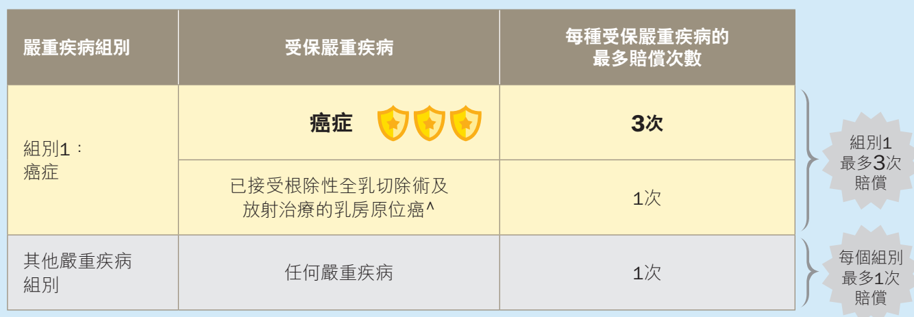
基本計劃及「多重附加契約」下的最多賠償次數

^ 「已接受根除性全乳切除術及放射治療的乳房原位癌」只在基本計劃的保障範圍之內。